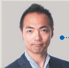
NRI ネットコム デジタルインテグレーション事業本部 デジタルマーケティング事業部 デジタルマーケティング事業推進課 主任