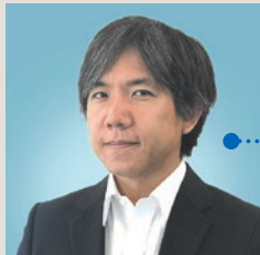
NRI ネットコム デジタルインテグレーション事業本部 デジタルマーケティング事業部 デジタルマーケティング事業推進課 上級

デジタルマーケティングには、Webサイトを訪問した人の振る舞いを解析することが効果的で有効であることは論をまたない。そのためのツールも、顧客チャネルのデジタル化の進展に合わせて進化してきた。本稿では、Web解析ツールを活用したデジタルマーケティングプラットフォームの在り方について考察する。