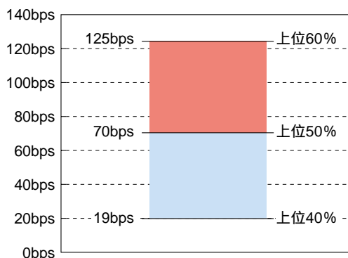
図表2 目に見えないコストの分布

る。つまり、平均を中心に上下10%の順位に位置する取引を比較しただけでも100bps以上もの差が生じてしまうのである。目に見えないコストを上手く管理できなければ、例え手数料の値下げで数bps稼いだとしても、その努力は簡単に吹き飛んでしまう。