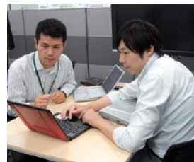
自家発電エリアでの縮退業務風景