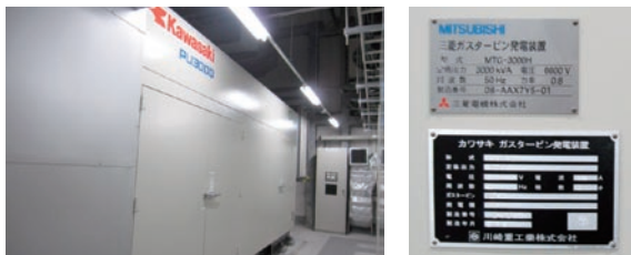
横浜ダイヤビルの自家発電装置（定格出力3,000kVA、最大連続運転70時間）

金融・資産運用ソリューション事業本部では、様々な災害シナリオに対応できるように代替オフィスの多重化を図っている。今回の訓練は、事業本部の主要拠点である横浜ダイヤビルが計画停電の対象となった場合を想定し、同ビル内に設置した自家発電エリアの代替オフィスにてヘルプデスク等のお客様向けの業務を中心に続行できることの確認を行った。