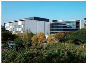
東京第一データセンター

NRIの東京第一データセンター（T1DC） (注) は、一般 社団法人グリーンIT推進協議会の「グリーンITアワード 2013」におい て経済産業大臣 賞を、また、公 益財団法人日本 デザイン振興会 の「2013年度 グッドデザイン 賞」を受賞した。