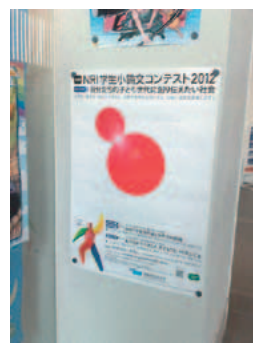
福岡大学 福岡金文堂(書店)入口