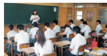
教室で生徒を前にコンテストをアピール