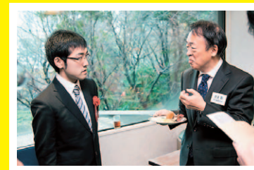
「社会人になったら自分のアイデアを実現できるように頑張りたい」

小学校の自由研究、中学校の調べ学習など、私が今まで取り組んできたことが実ったのが、今回の論文です。私の故郷・鹿児島でも、緑化した市電の軌道数が増えていますし、隣の熊本でもこの活動が広がっています。これまで都市部といえば、グレーなコンクリートのイメージがありました。これからは緑の多い都市部になってほしいと思います。今回論文執筆を経験し、改めて環境について深く学びたいという思いを強くしました。