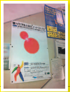
北海道大学 札幌キャンパス 中央食堂階級の掲示板