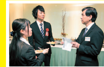
論文についての感想を聞く入賞者