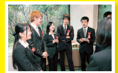
論文に書ききれなかった想いも存分に語り合う入賞者