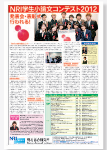
「高校生新聞」2013年3月1日号(第204号)