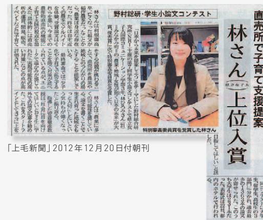
「上毛新聞」2012年12月20日付朝刊

NRI学生小論文コンテストは、毎年、さまざまなメディアに取り上げられています。 その一部を、紹介いたします。