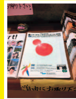
金沢大学 学生会館

今年も全国でコンテストを告知しました。大学敷地内の掲示板や書店のインフォメーションコーナーにポスターやチラシを掲示するなどして、コンテストをアピールしました。また、NRIグループの社員有志が、出身校にメッセージカードを添えてポスターやチラシを送ったり、実際に母校に足を運んだりしながら、学生たちに応募を呼びかけました(詳しくはP92)