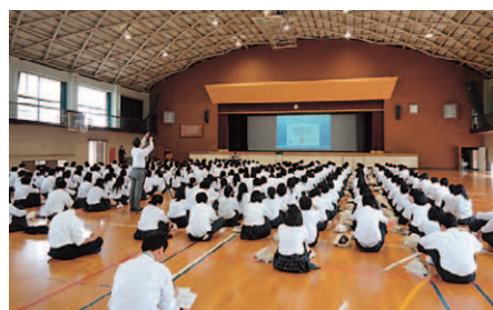
体育館で2年生にコンテストを紹介

母校の2年生の生徒全員 (317名) に、キャリア教育の一单元「未来のシナリオづくり」の中で、コンテストへの応募を呼びかけました。社内応援団としての訪問は、今年が4回目になります。社会人生活やNRIの事業について説明を行い、応募要項を案内しました。今年は先生方から「2年生を対象に小論文を書かせて応募させます」と心強い回答をいただき、うれしく思っています。