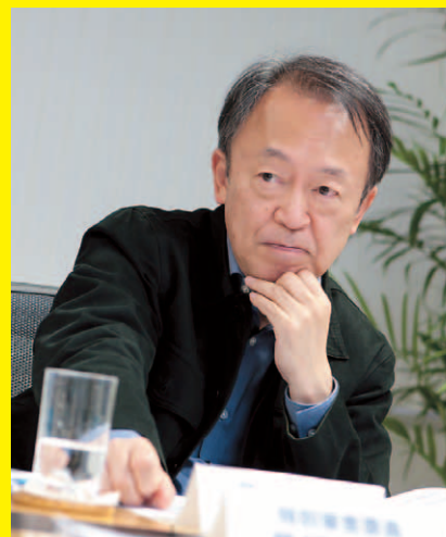
特別審査委員 最相 葉月 さん ノンフィクションライター

今年のテーマは、筆者が自ら何をしたいかを問うものでした。そのため自分の経験、可能性を自分の言葉で語っている、バラエティに富んだ論文が多かったと思います。また参考文献にウィキペディアを挙げるようなものはなく、書籍や公的機関が提供しているデータなどを参考にして思考を深めている作品が多かったのが印象的です。どの論文も読んでいて、大いに楽しむことができました。