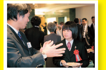
「小学生の頃から興味のあるテーマだったんだね」