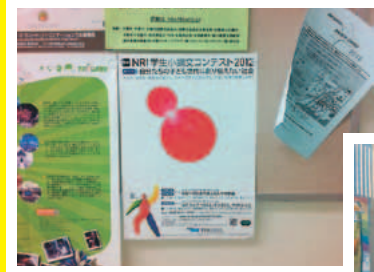
愛媛大学 国際連携支援部 国際連携課