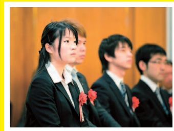
審査員たちの温かいコメントに真剣に聞き入る入賞者たち