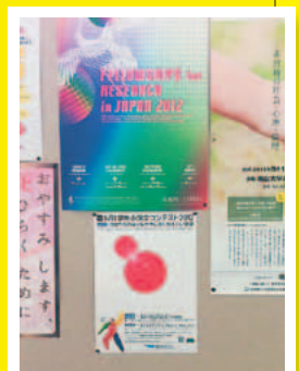
南山大学 国際教育センター