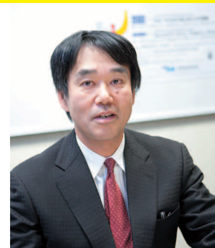
特別審査委員 池上 彰 さん ジャーナリスト・東京工業大学教授

若い世代が書いた多くの論文を読んで、明るい希望を持つことができました。高校生の部では、楽しく夢のあるテーマが多く、留学生の部では「こういう考えの人がいるなら近隣諸国との問題もいずれ解決するに違いない」と期待を持ちました。大学生の論文には、未来に向けた挑戦が数多く書かれていました。日本の閉塞感を打ち破るきっかけとなる、将来の社会への希望が感じられる提案ばかりでした。