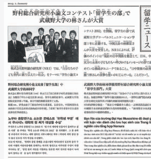
「月刊留学生」2013年1月号 (注)写真は2011年の入賞者