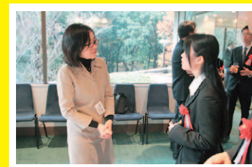
最相さんからのコメントは気になるもの