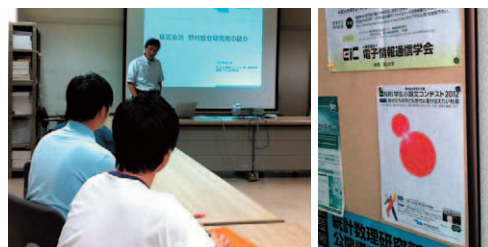
学生たちに、NRI とコンテストを説明

母校の工学部と農学部を訪問し、「NRI 学生小論文コンテスト2012」に関して教授と学生に説明してきました。コンテストについては、プロジェクターを用いた会社説明の中で触れ、募集をお願いしました。夏休み期間中でもあったので、集まった学生は8名程度でしたが、NRI という会社に興味のある学生らと積極的な質疑応答のやりとりができました。