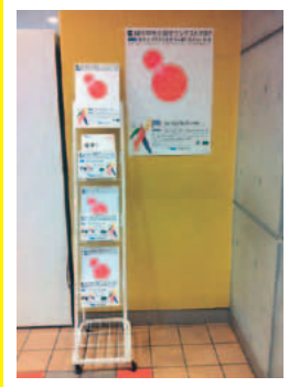
法政大学 市ヶ谷キャンパス 食堂「フォレストガーデン」入口