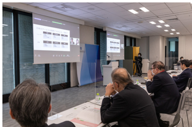
最終審査会もオンラインで