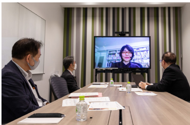
オンラインで行われた論文審査会