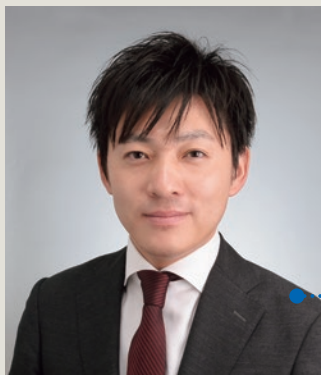
野村総合研究所 コンサルティング事業本部 ICTメディア・サービス産業コンサルティング部 主任コンサルタント