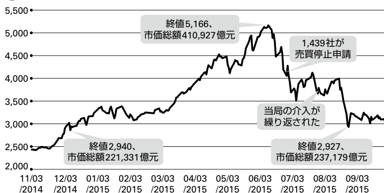
図1 上海総合指数 (2014/11 ~ 2015/09)

「場外配资」とは、もともと存在する民間融資会社が株式購入のための資金を融資するという民間信用取引である。その特徴は資金融資だけで空売りができないことである。株式市場好転の中で、条件の厳しい証券会社の信用取引を利用できない、または利用したくない投資家はこの