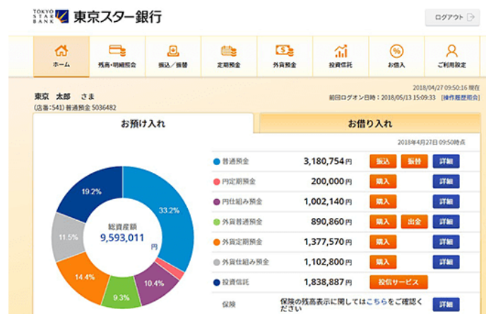
図1：ログイン後のトップ画面イメージ

利用者のログイン後のトップページで、円預金、外貨預金、投資信託の総資産情報(円グラフ) および借入情報を表示することにより、資産状況が一目で把握できます。