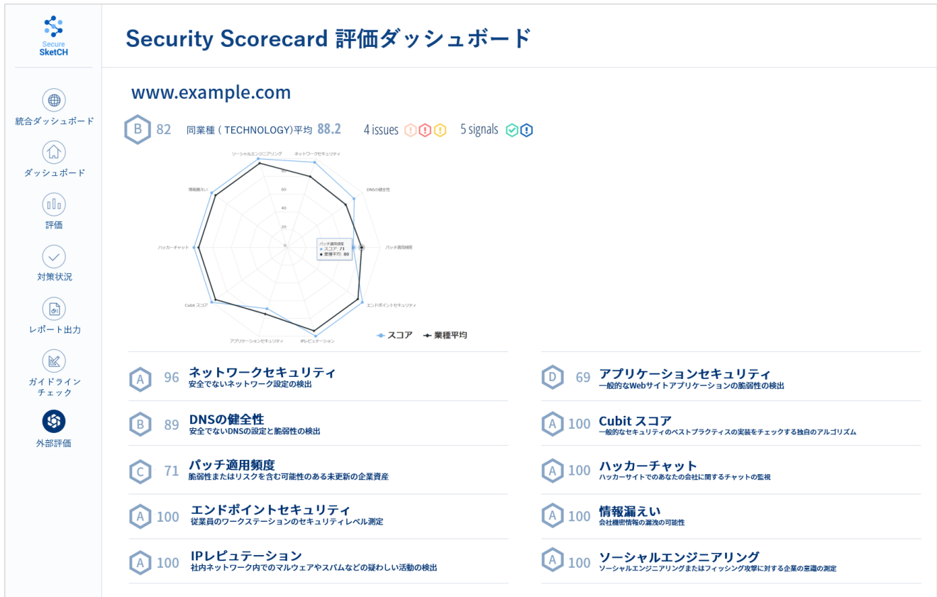
図 2：新機能「外部セキュリティスコア自動算出機能」の画面イメージ

今回加わる新機能では、担当者が設問に回答する必要はなく、外部評価の結果が点数（スコア）として自動的に算出され、毎日更新されます（図 2）。担当者は、内部評価に加えて、外部評価の結果を同一の画面で随時確認できるようになるため、セキュリティ業務のさらなる効率化・高度化が期待できます。