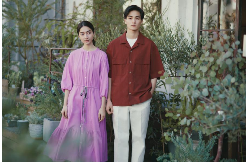
「CB CRESTBRIDGE」2022 年春夏プレコレクション イメージビジュアル