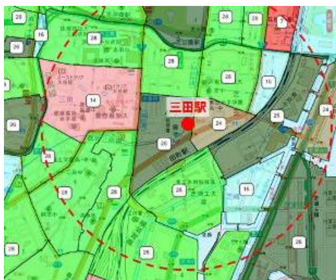
図表4： 三田駅(都営浅草線・三田線)周辺を金融版居住者特性エリアタイプで分析したイメージ