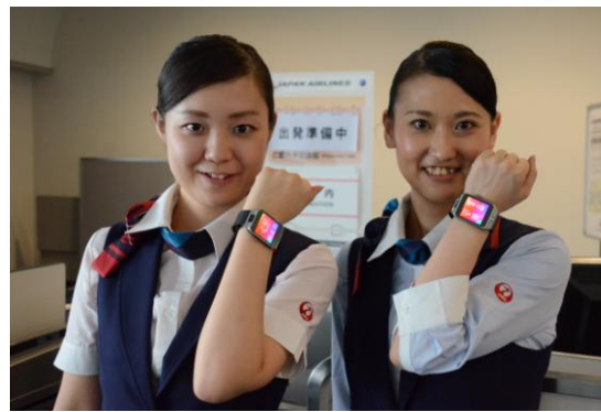
スマートウォッチを装着するスタッフ