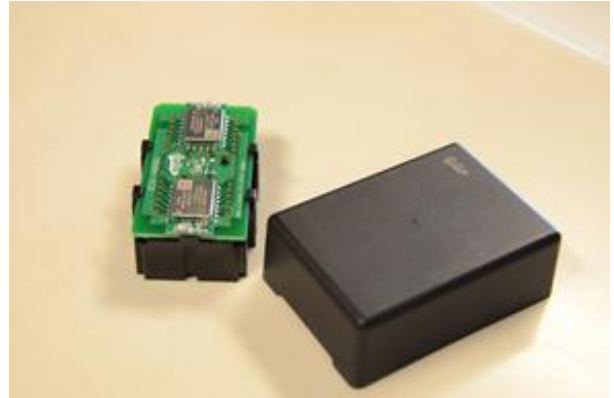
ゲートに設置されるiBeacon

実証実験は、「GALAXY S5」ならびに「GALAXY Gear2」に加えて、Android Wear™※4を搭載した「LG G Watch」※5など、最新のスマートウォッチにつきましても対象としており、お客さまの利便性向上に寄与するさまざまな活用シーンを含めた検討を予定しています。