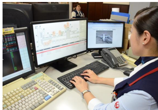
株式会社 NTT ドコモより提供される「GALAXY Gear2 (右)」 位置情報を見てコントロールするデスク担当者 (左は「GALAXY Gear Fit」サムスン製)