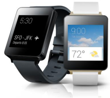
LG G Watch

実証実験は、「GALAXY S5」ならびに「GALAXY Gear2」に加えて、Android Wear™※4を搭載した「LG G Watch」※5など、最新のスマートウォッチにつきましても対象としており、お客さまの利便性向上に寄与するさまざまな活用シーンを含めた検討を予定しています。