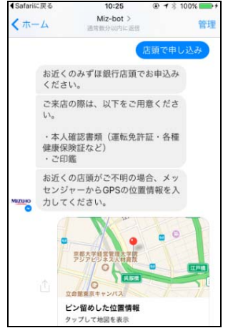
(左上・右上) 500Startups とのプロトタイプに関する議論 (左下)Amazon Echo のマーケット(Skill)に仮搭載したみずほアプリ (左下の中央左)AmazonEcho を活用した音声によるバンキング実験 (右下二つ)Facebook bot を活用した口座開設の画面案