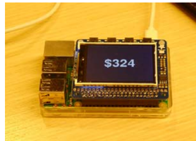
(左・右上) WiL におけるプロトタイプに関する議論、フィードバック等 (右下)AmazonEcho による音声を通じたバンキングサービスと連動させた画面表示デモ(預金口座の残高表示)

【本件に関する照会先】 株式会社みずほ銀行 コーポレート・コミュニケーション部 03-5252-6574 株式会社電通国際情報サービス コーポレートコミュニケーション室 03-6713-6100 株式会社野村総合研究所 コーポレートコミュニケーション部 03-6270-8100