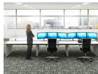
スモールオフィス